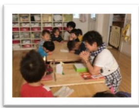
アドベント第1週の礼拝の様子です