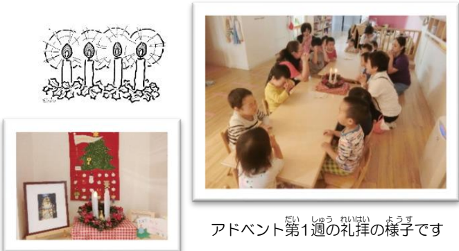
アドベント第1週の礼拝の様子です

四本のろうそくにはそれぞれ「希望」「平和」「よろこび」「愛」という意味があります。さくらっこの幼い子どもたちには少しむずかしいかな、とも考えましたが、「待つ」ということの大切さ、そしてろうそくの灯りが増えるとともに明るさが増すことを感じながら、ろうそくに灯をともしたいと思っています。